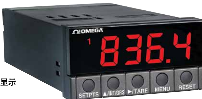
DP25B-S，图片小于实际尺寸。