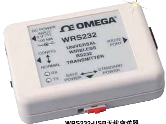
WRS232-USB无线变送器, 图片接近实际尺寸。