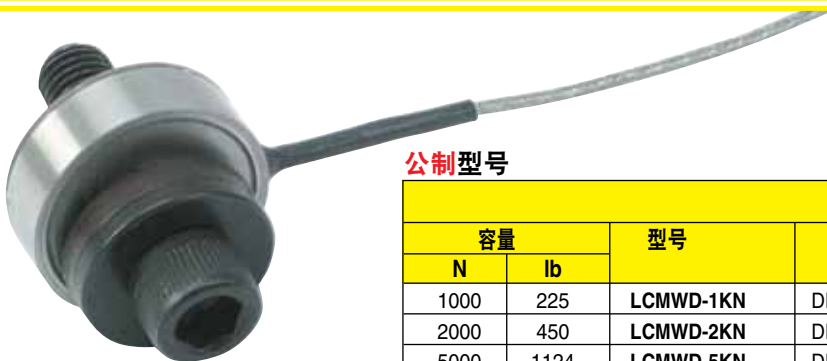
公制 LCMWD-1KN, 带球形垫圈 (内含), 图片为实际尺寸。