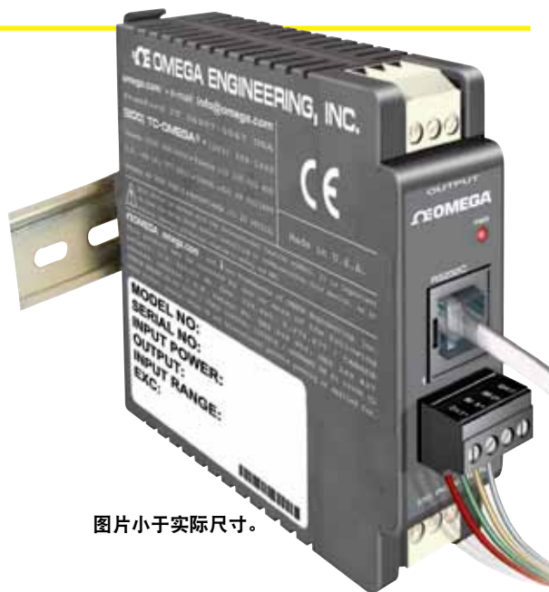
图片小于实际尺寸。

iDRN-ST和iDRX-ST信号调节器为称重传感器等应变片传感器、扭矩传感器、未放大型压力传感器以及其它基于电桥的传感器提供极其准确、可靠的隔离测量值。两种型号都接收30 ~ 100 mV满量程之间的信号, 并提供可用于传感器激励的10 Vdc基准电压。