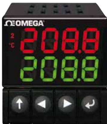
CN16DPt 系列，图片为实际尺寸。