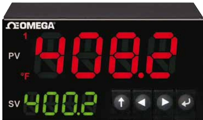
CN8DPt 系列，图片为实际尺寸。