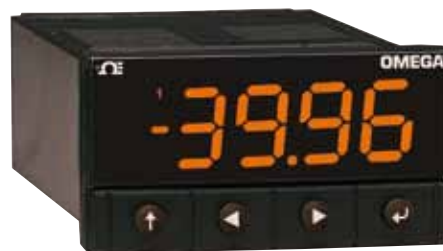
CN32Pt 系列，图片为实际尺寸。

PLATINUM 系列带微处理器的 PID 控制器家族为过程测量提供无与伦比的灵活性。该产品经过精心设计，功能强大、灵活易用，安装和使用起来极为方便。自动硬件配置识别功能避免了跳线的使用，可让固件自动实现简化，并取消了所有不适用于特定配置的菜单选项。该系列控制器提供 1/32、1/16 和 1/8 三种 DIN 尺寸，其中，1/16 和 1/8 DIN 型号可配备双显示屏。