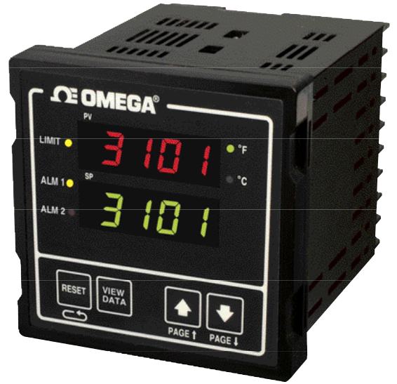
CN3101系列配套限值控制器——接受热电偶、RTD和过程信号。