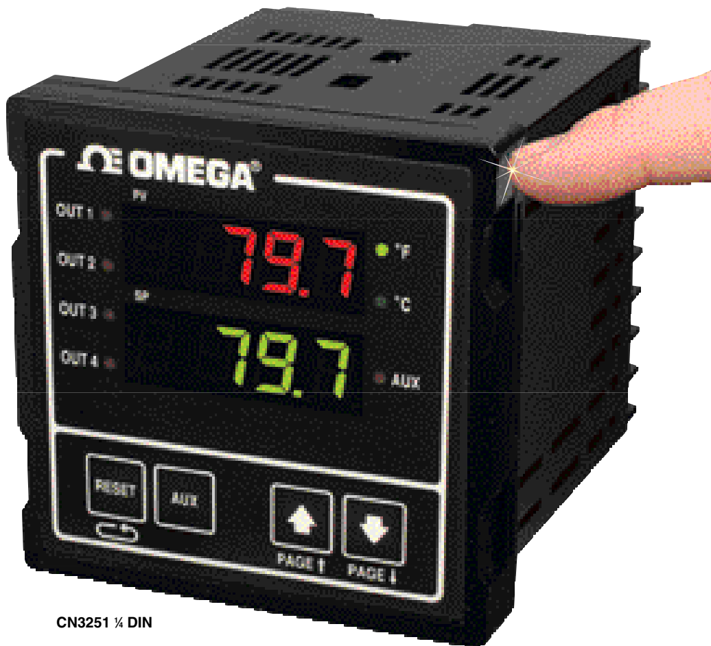
CN3251 ¼ DIN

CN3251 ¼ DIN温度和过程控制器是一款经济实惠、性能出众的单回路控制器，可用于温度、流量、压力和液位控制应用场合。由于具备通用传感器输入以及前面板操作设置，可以根据各种应用在现场方便地配置CN3251控制器。如果应用的要求变化，只需重新配置即可。因此，对于有着多种控制需求的应用、生产工厂、测试机构和测试应用，它也就成了不二之选。