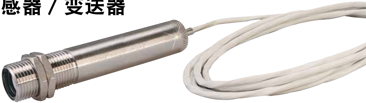
OS136小型不锈钢传感器 / 变送器, 带NEMA 4外壳, 图片为实际尺寸。