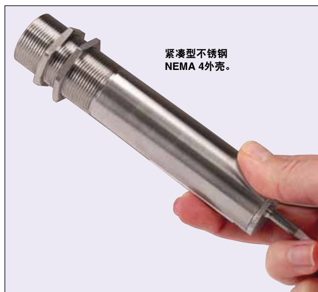
紧凑型不锈钢 NEMA 4外壳。

OMEGA® 紧凑型高性能工业级红外线传感器 / 变送器型号OS137可提供各种功能和选件，均封装在一个小型不锈钢外壳中。标准功能包括：可调节的发射率，10比1光学视场，可调节的报警设定值和驱动外部继电器的电压输出，以及6种预选模拟信号输出，可与所有仪表、控制器、数据记录器、记录仪、计算机板卡和 PLC 轻松连接。该装置配备2个六角螺母、用于电源和输出连接的1.8 m (6')屏蔽电缆和完整的操作手册。