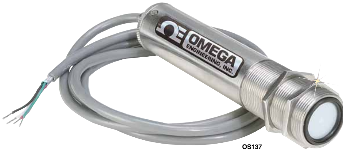
OS137 图片小于 实际尺寸。